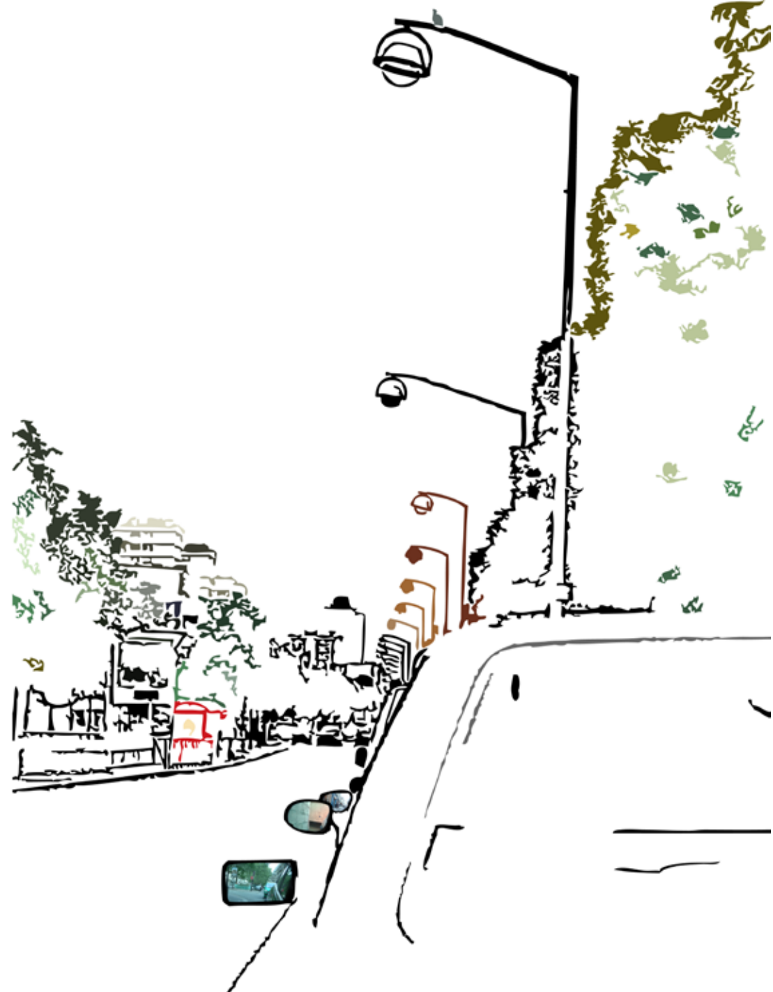
Vertical symmetry... & biased reflections FRANCE - 2007

Vue aérienne de la capitale, révélant l'aspect condensé de l'urbanisme beyrouthin. Entre promiscuité et harmonie.