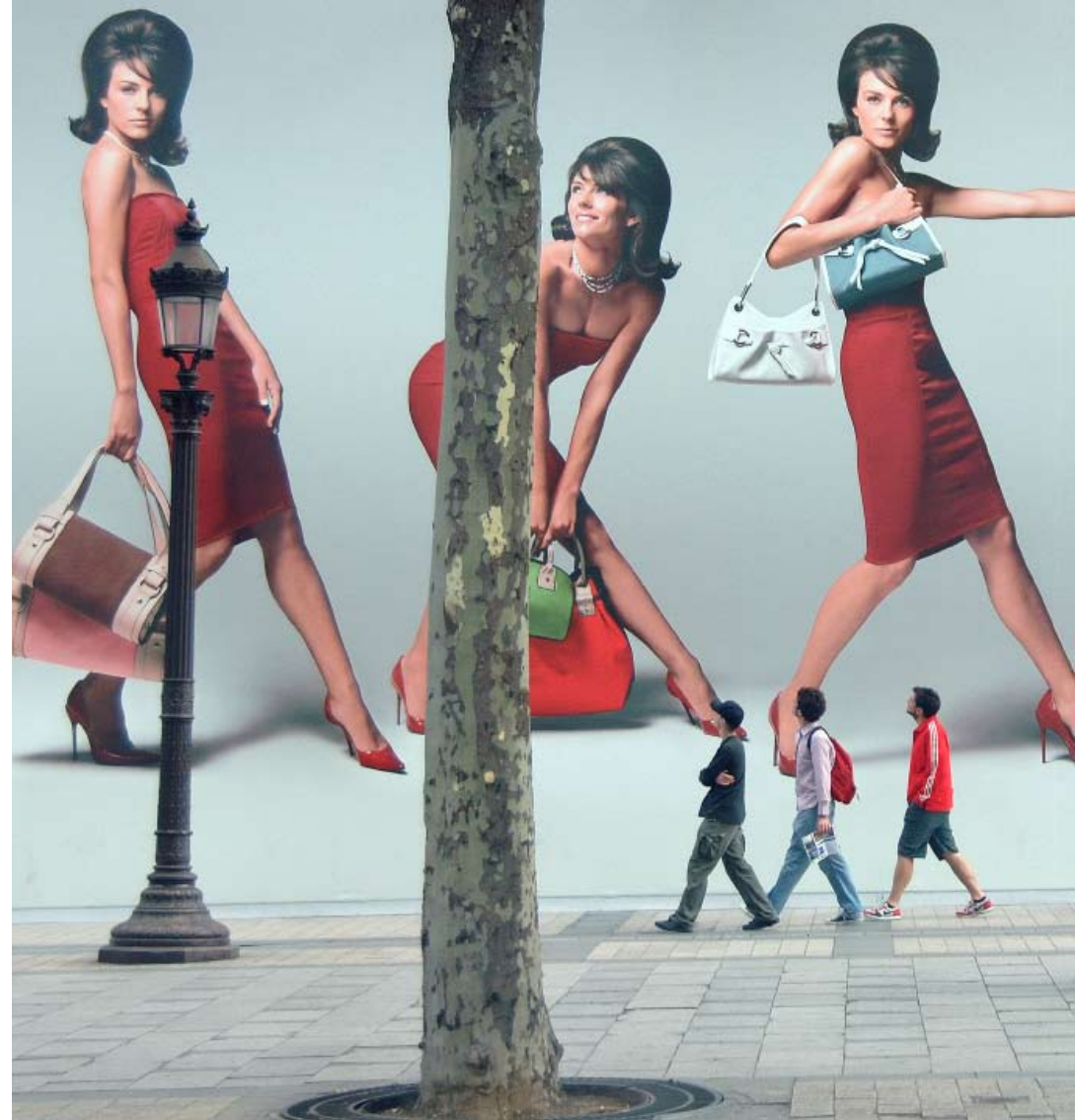
The Liz effect FRANCE - 2005

La fascination des Libanais pour les beautés venues du froid. Image vectorielle d'une Victoria réelle, remodelée sous environnement virtuel.